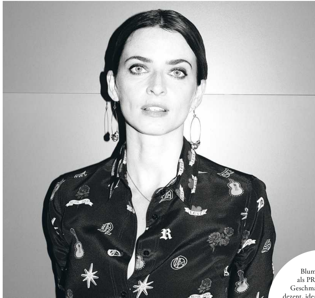
Model und Unternehmerin Eva Padberg

Sind Ihre Augen eigentlich grün? »Nein, sie sind blau.« Wirkt aber anders. Sie lächelt. »Das liegt am Sofa.«