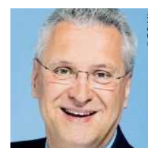
Joachim Herrmann Bayerischer Staatsminister des Innern, für Bau und Verkehr