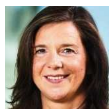
Katrin Göring-Eckardt Vorsitzende, Bundestagsfraktion von BÜNDNIS 90/DIE GRÜNEN