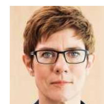
Annegret Kramp-Karrenbauer Ministerpräsidentin des Saar- landes