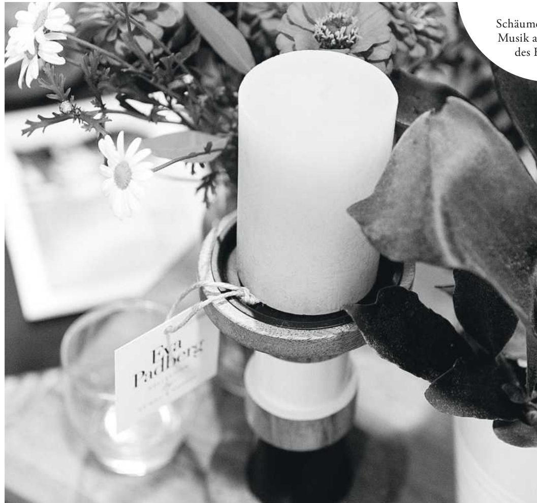
Wohnaccessoires von Eva Padberg