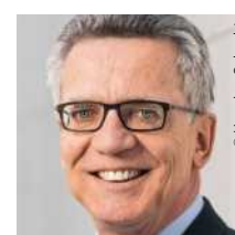
Dr. Thomas de Maizière Bundesminister des Innern