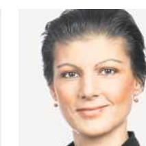
Dr. Sahra Wagenknecht Vorsitzende, Bundestags- fraktion DIE LINKE